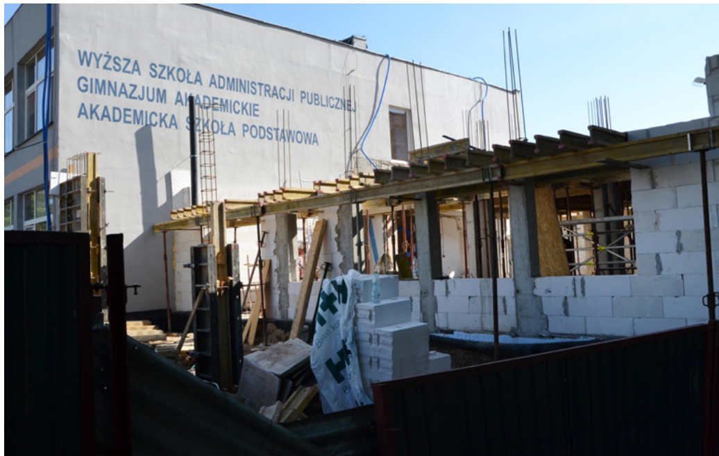
W nowo budowanej części pawilonu mieścić się będą stołówka, szatnia oraz sale lekcyjne.

- Otwierając naszą szkołę postanowiliśmy, że nie będziemy mieli wielu uczniów i nic się w tej kwestii nie zmieniło. Dla nas liczy się jakość, nie ilość. Celem trwającej właśnie rozbudowy jest wy-