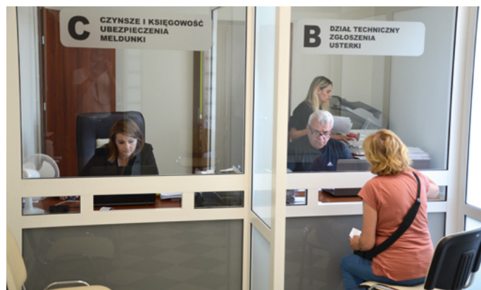
Sala konferencyjna w budynku administracji osiedla musiała być przerobiona na Biuro Obsługi Interesantów.