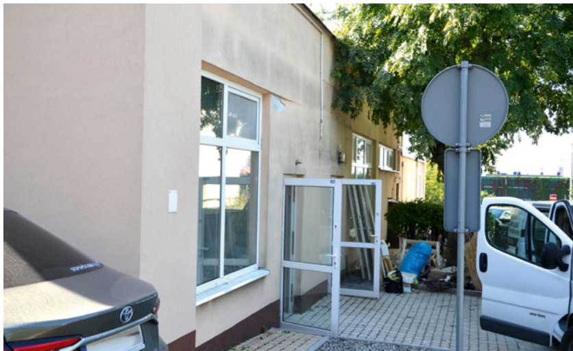
Sala spotkań z mieszkańcami mieścić się będzie na parterze pawilonu przy Konopnickiej 5.

Władze spółdzielni postanowiły stworzyć salę spotkań z mieszkańcami. Mieścić się będzie w lokalu, w którym niegdyś funkcjonował sklep papierniczy w pawilonie usługowym przy ul. Konopnickiej 5 - od strony bloku przy Konopnickiej 3.