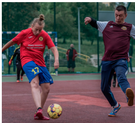
Zawodnicy dawali z siebie wszystko by znaleźć się w gronie zwycięzców.